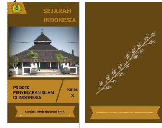
Gambar template cover depan & cover belakang E-Modul

Berikut adalah gambaran tampilan cover depan dan sebagian materi pengembangan dari produk E-modul Sejarah.